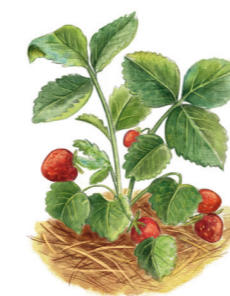
Paillage du fraiser