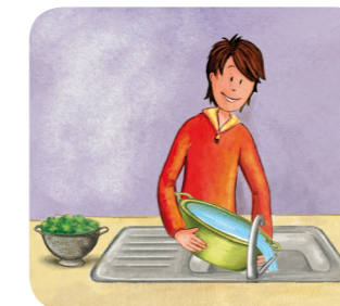
Eau de lavage des légumes jetée