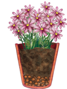
Pot avec billes d'argile