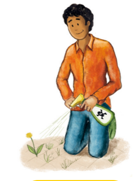
Désherber avec un pesticide