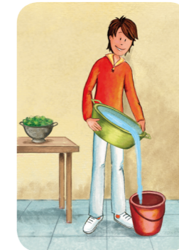
Récupération d'eau de lavage des légumes