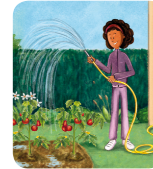
Arrosage avec eau potable