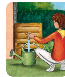
Arrosage avec eau de pluie