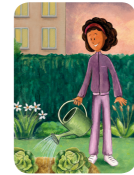
Arrosage le soir