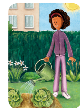
Arrosage en plein soleil